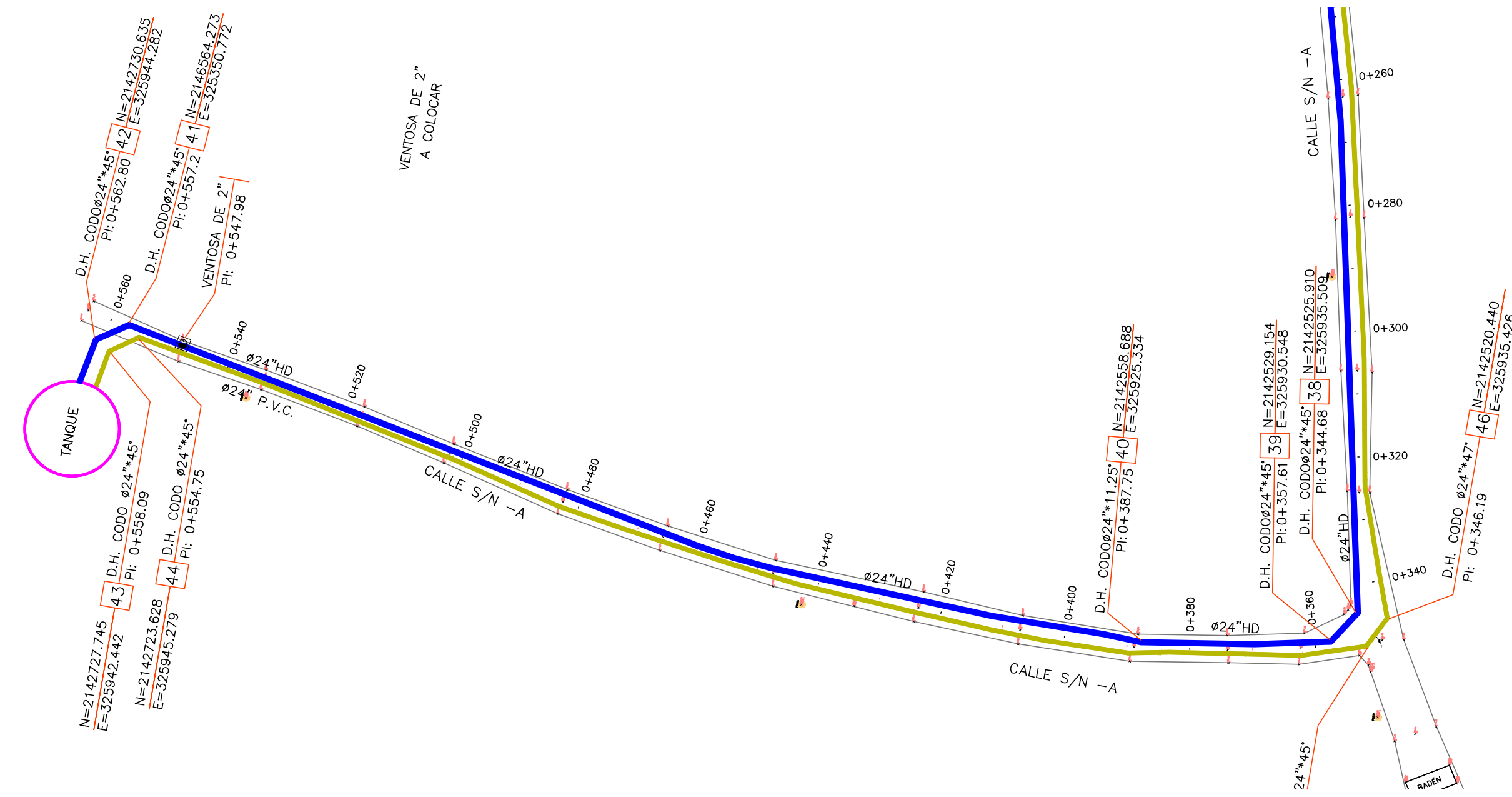
PLANIMETRIA CALLE S/N - A TRAMO E-0+360 A E-0+562.80